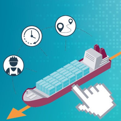
Projekt SCEDAS: Optimierung von Ship Operations